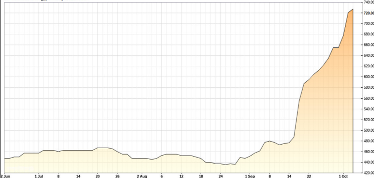
JF11 - Urea FOB Egypt - Daily Area Chart

Europa es netamente deficitaria de urea, y este año lo será mucho más por los aludidos costes energéticos, que desincentivarán su producción a nivel interno. Habrá que importar pues más del 75 % de la que se consuma, con Egipto como primer proveedor tradicional, con una cuota prevista de entre un 75 y un 80 % del total.